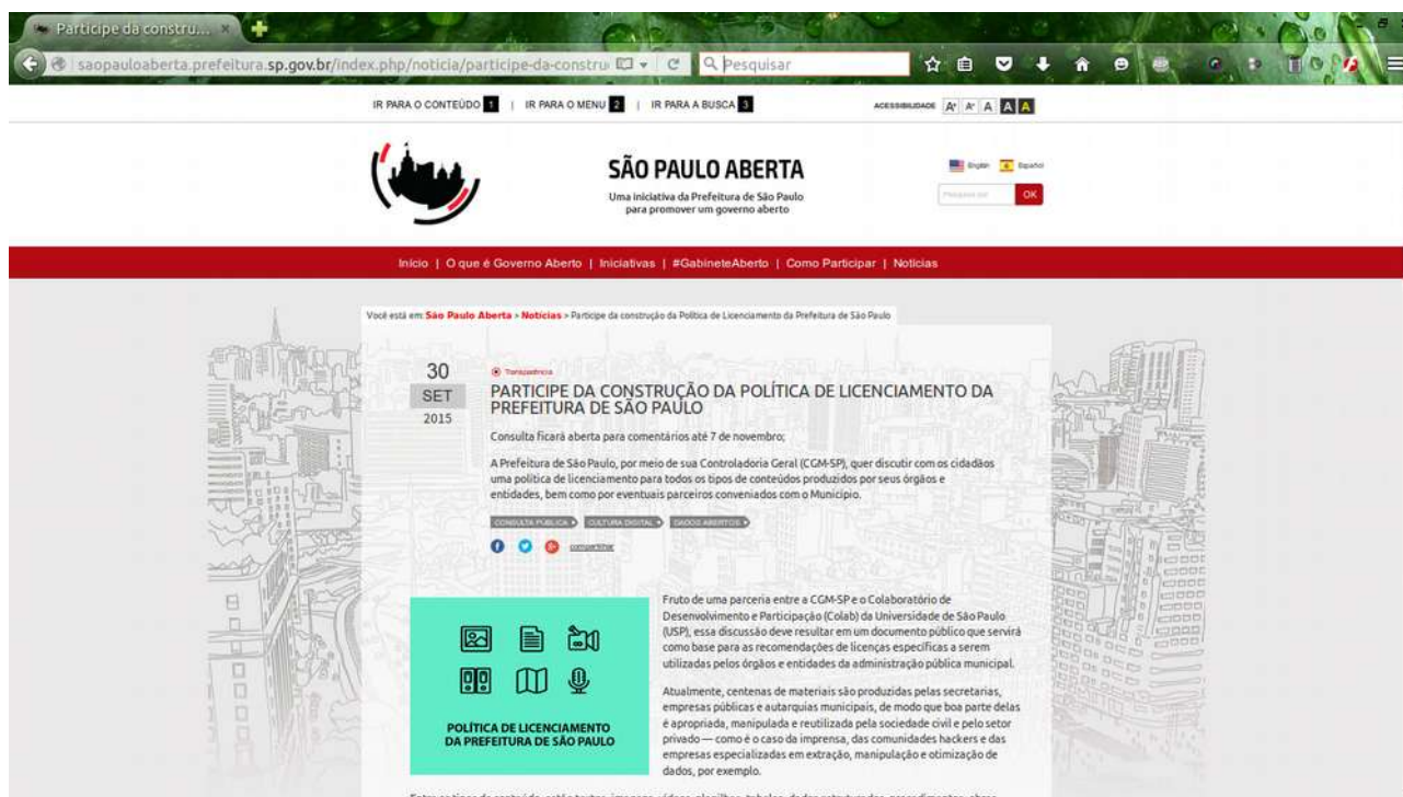
Página web da consulta no Portal São Paulo Aberta.